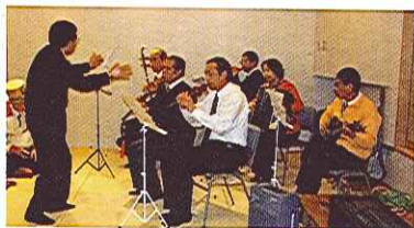
中国帰国者シーヤンホン歌舞団

中国では「夕陽紅」(シーヤンホン)とはシニアを表す言葉ですが、もっと素敵なのという表現もあります。落日前の夕陽は赤く、しかもまだ情熱に溢れています。夕日は遅く咲く花、長く寝かせた酒、遅れた愛、終わらぬ愛情。