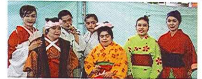
聖幻会知的障害者舞踊

北九州市内学校、作業所、工芸舎に通う踊りが大好きなメンバーで構成し、活動開始。 多くの場での活動が認められ、平成14年に「新日鐵地域社会貢献賞」受賞。 平成19年「日韓交流の大使」を務める。ボランティア活動を通し、喜び・楽しみ・生きる事の素晴らしさを感じていただけるよう活動を続けている。